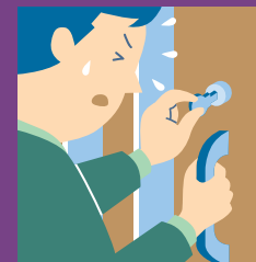
ドアの鍵が閉まりにくい