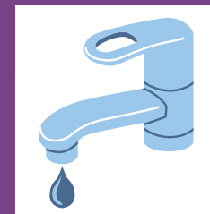
蛇口から水が漏れる