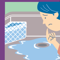
台所の排水が悪い